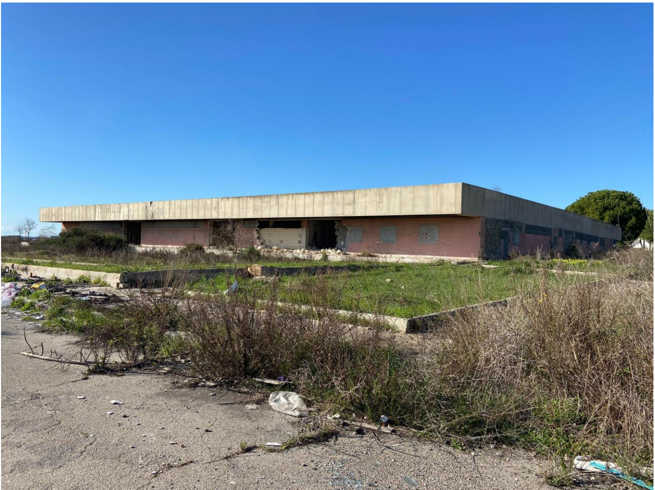
Foto1. Involucro edilizio stato di fatto