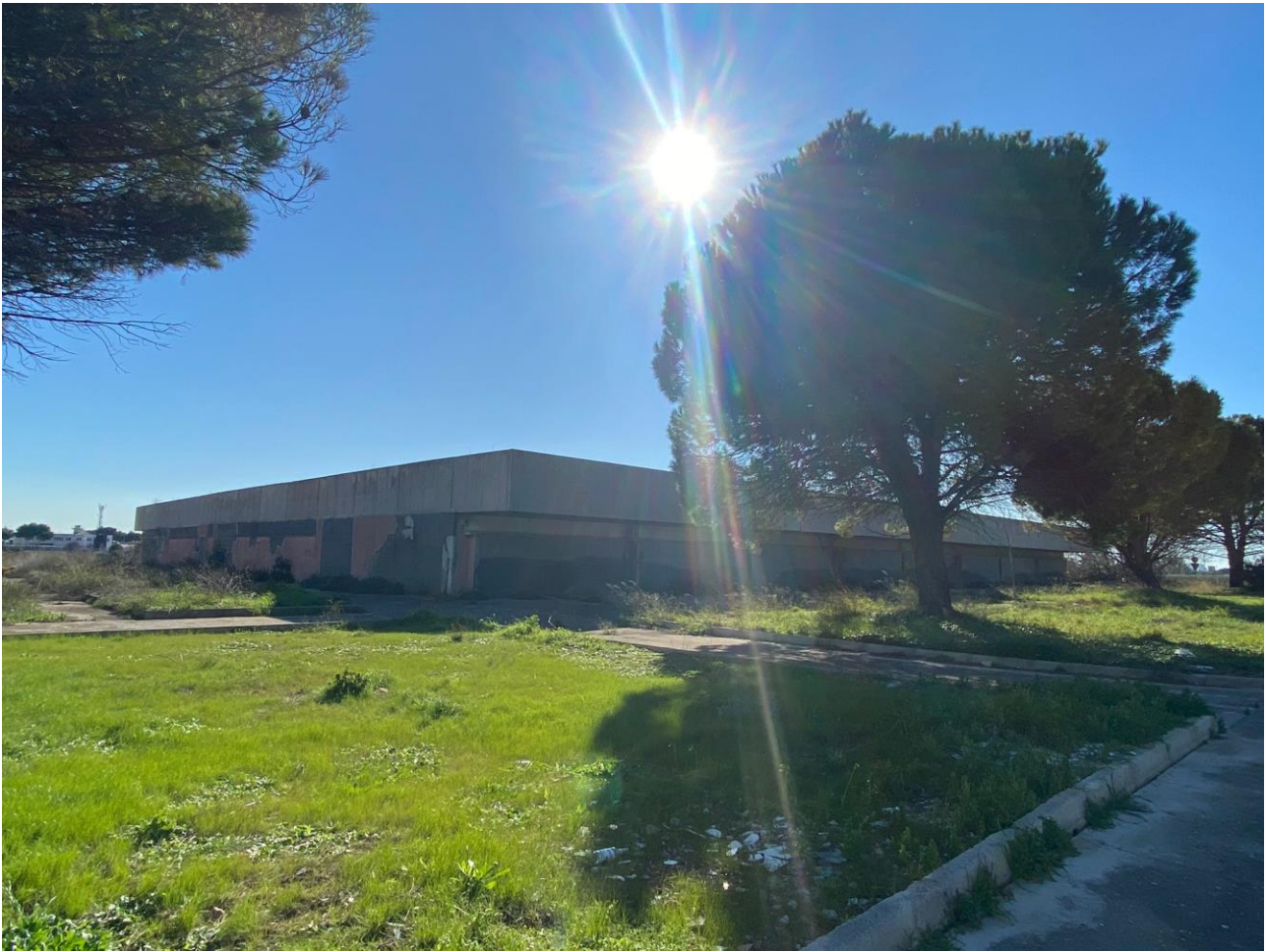
Foto 3. Area scoperta con alberture