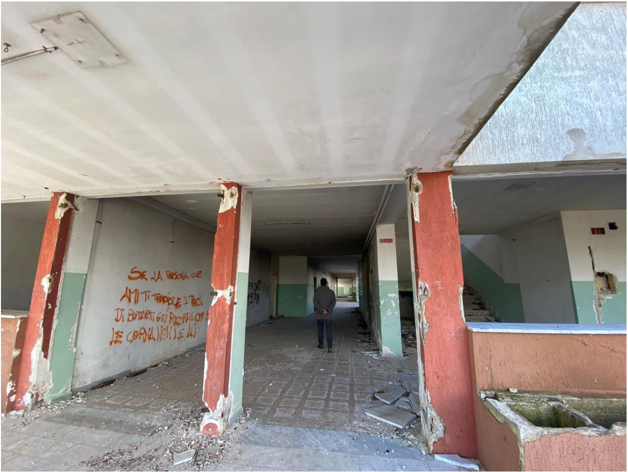
Foto 2. Particolare dell'androne