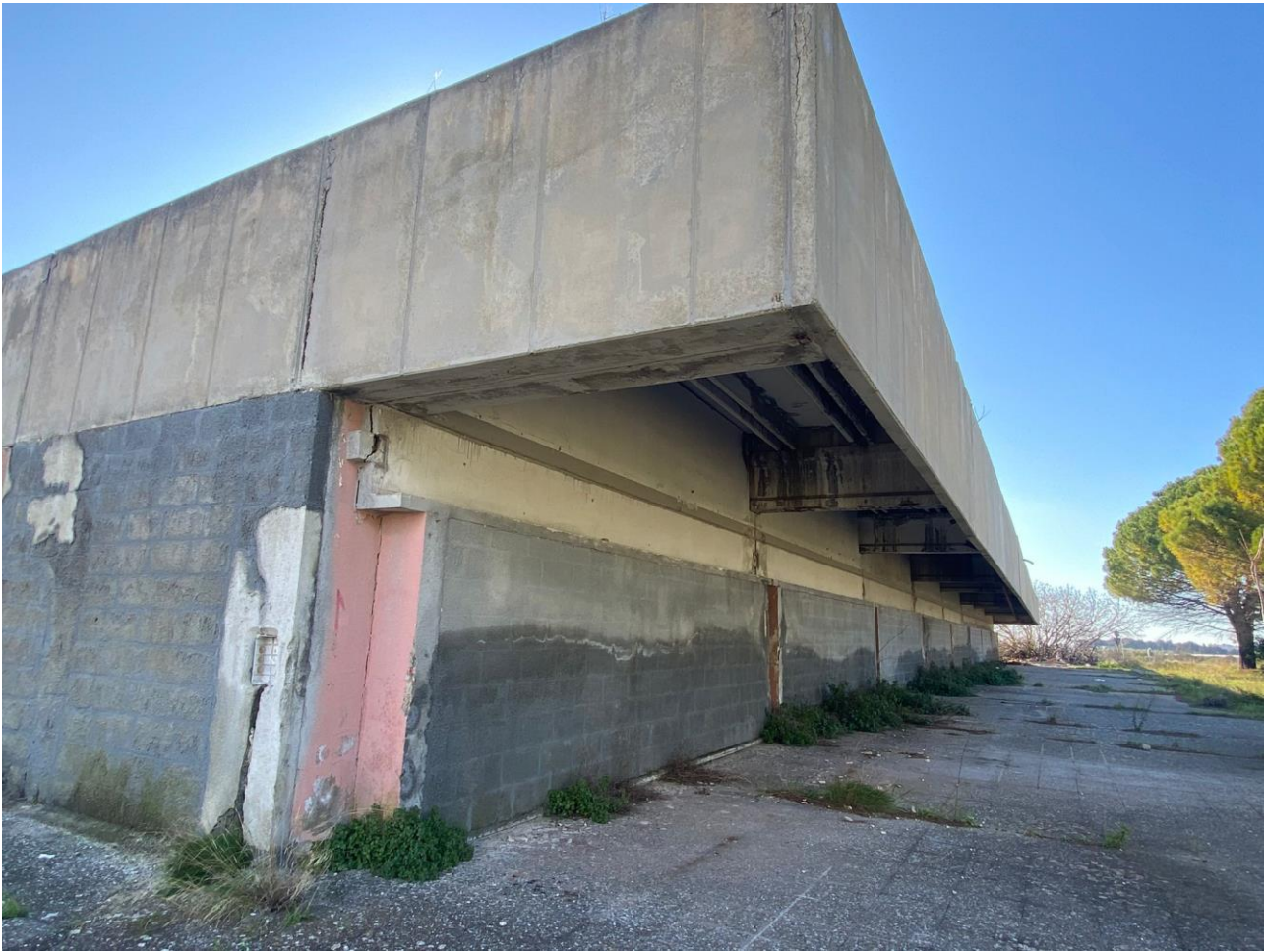
Foto 2. Particolare degli accessi laterali ai locali commerciali e servizi igienici