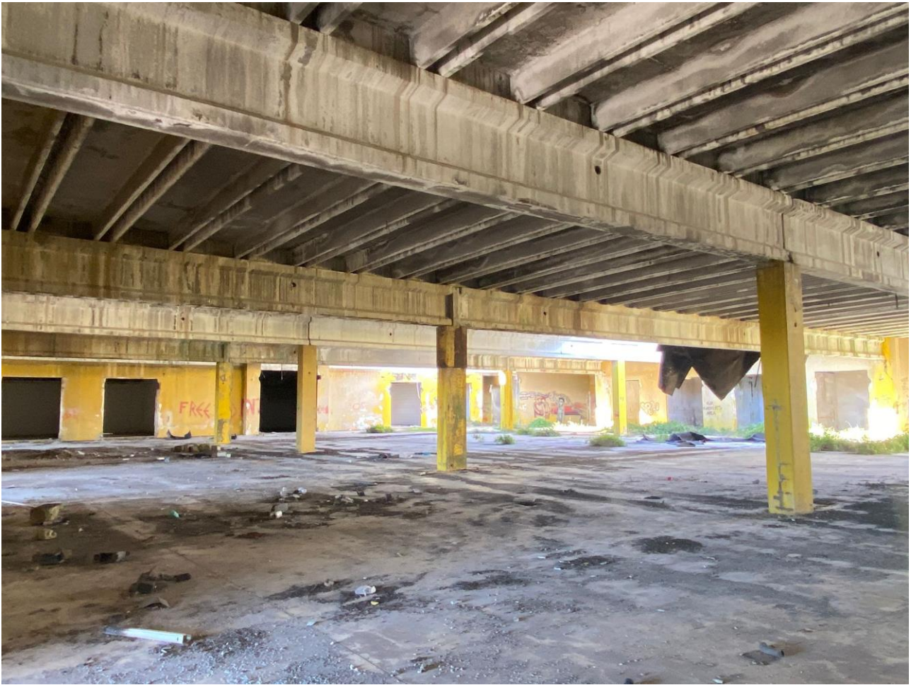
Foto 5. Spazio interno libero senza tramezzature