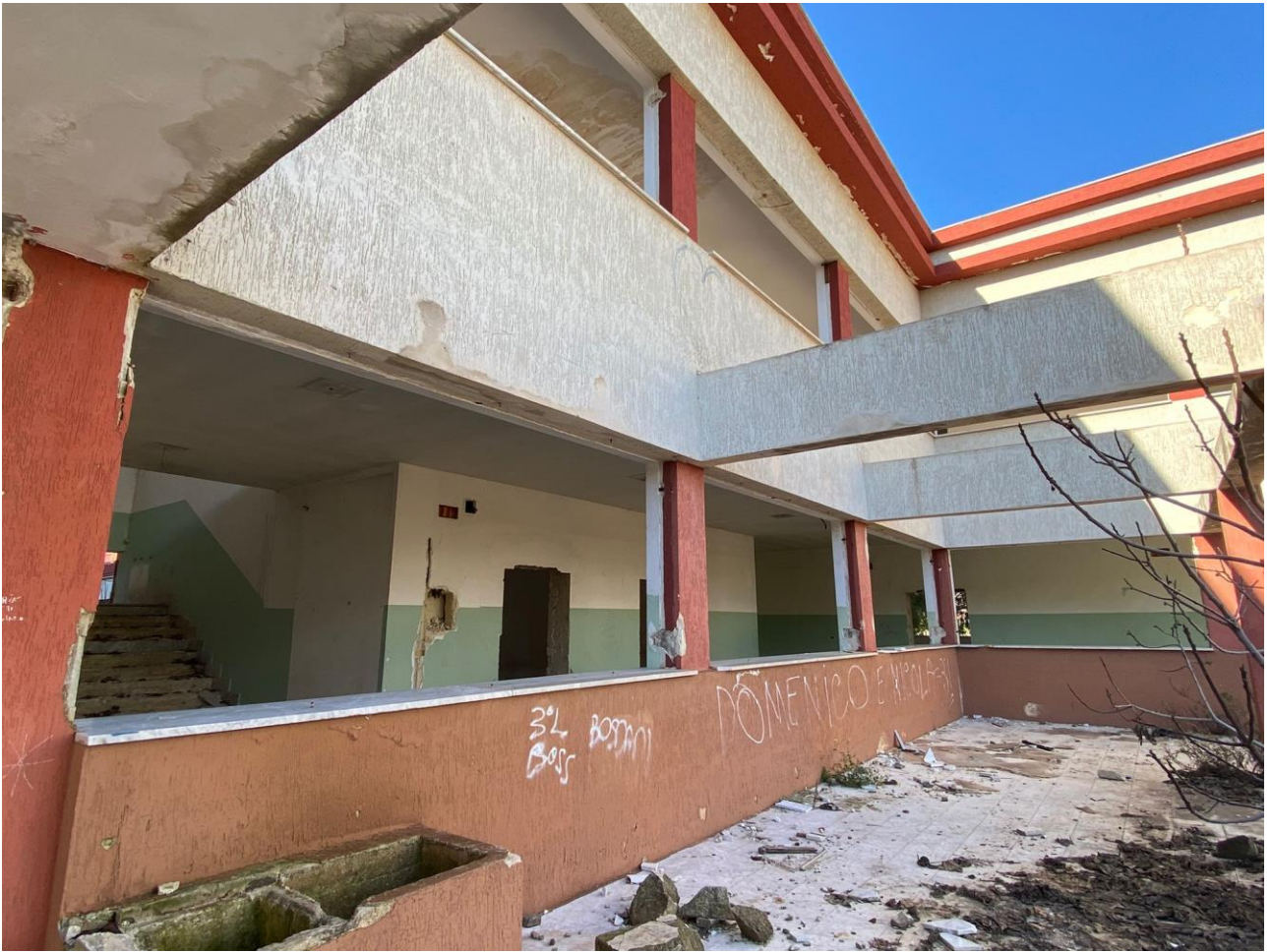
Foto3. Particolare del cortile interno ubicato a nord.