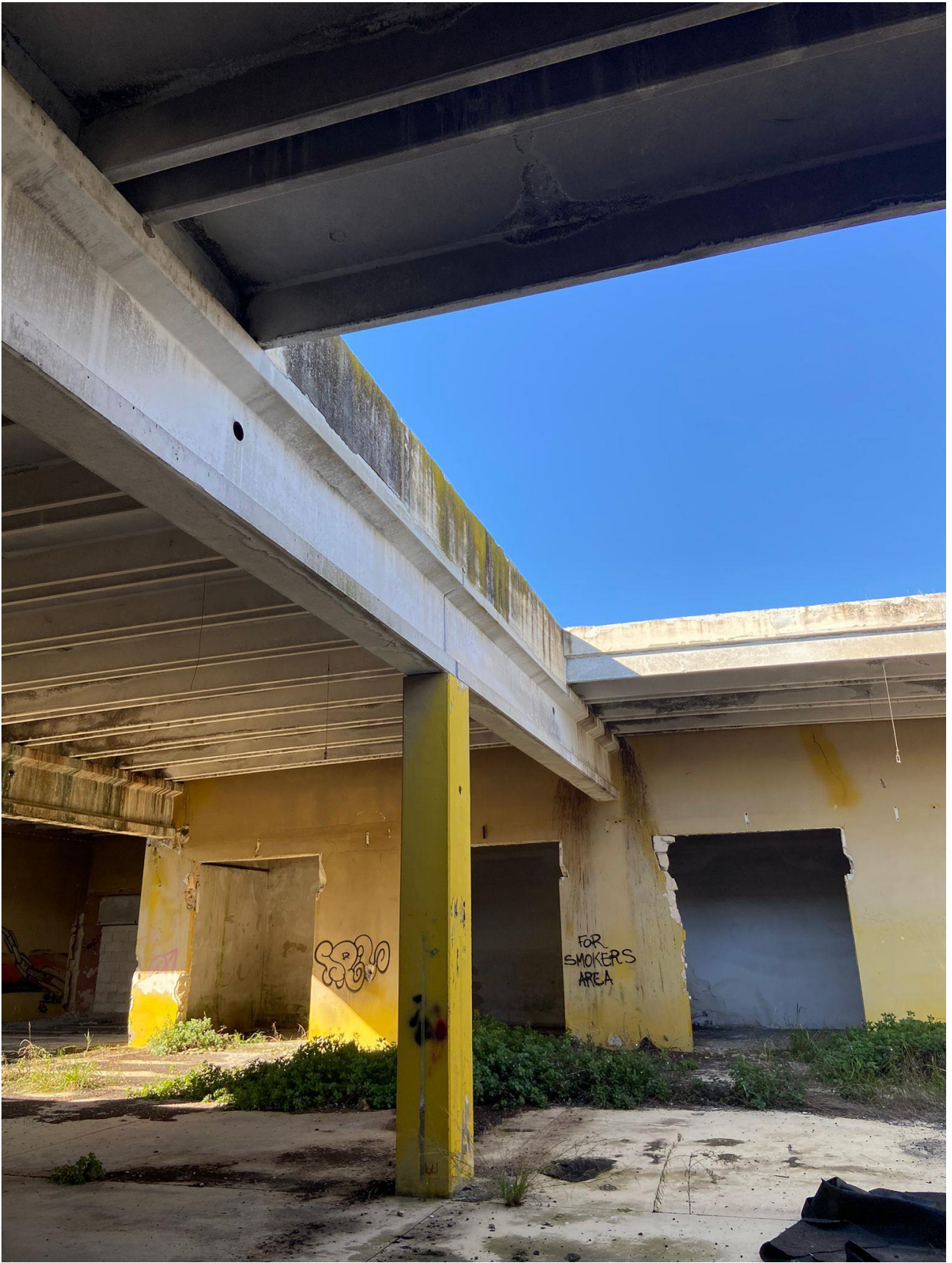
Foto 6. Lucernaio