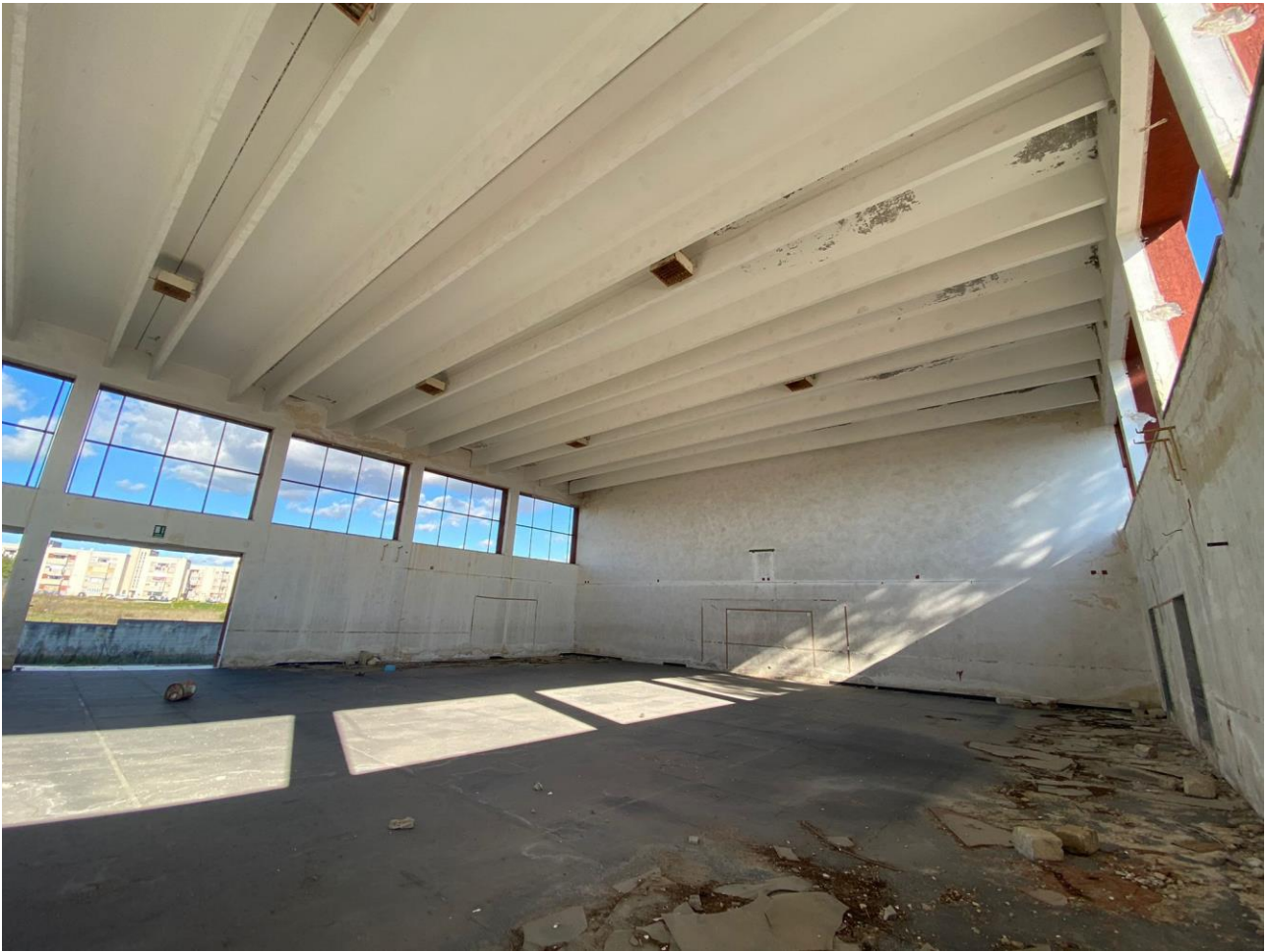
Foto 5. Particola palestra interna