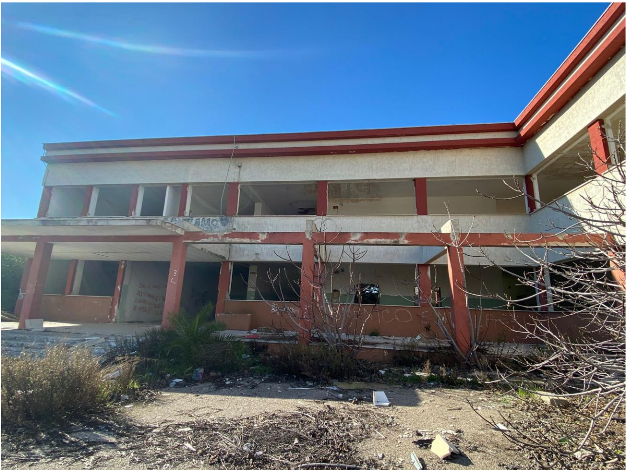
Foto 1. Ingresso scuola con particolare del porticato prospiciente